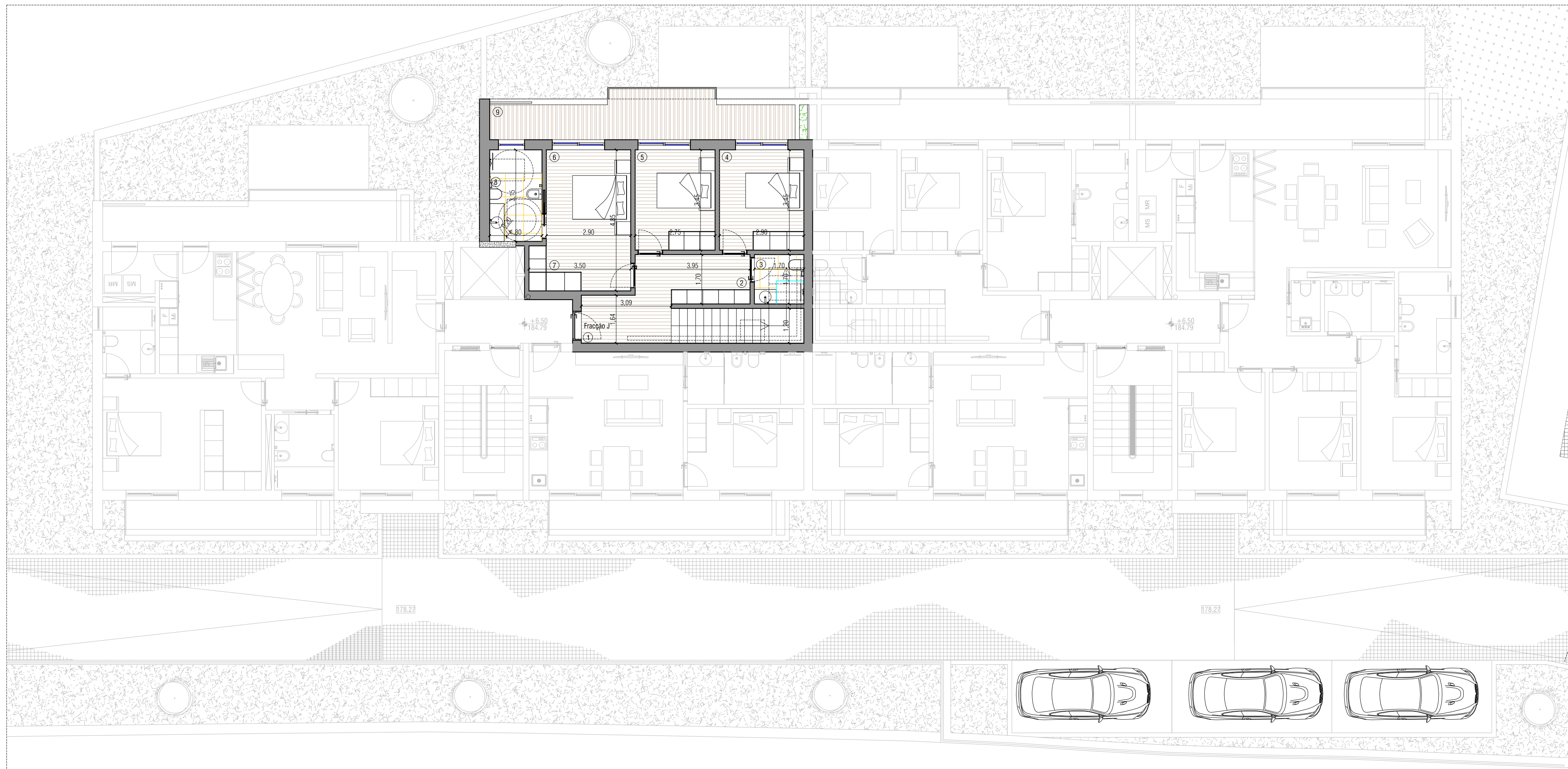
PLANTA DE PISO 3